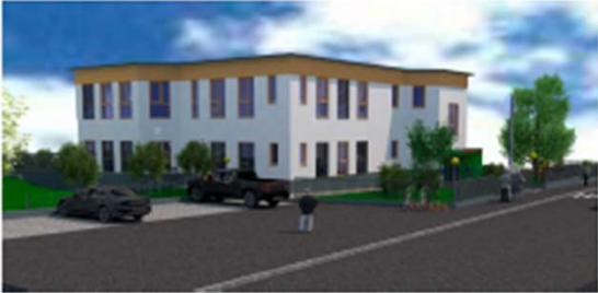
SCHAUBILD VON SÜDWESTEN