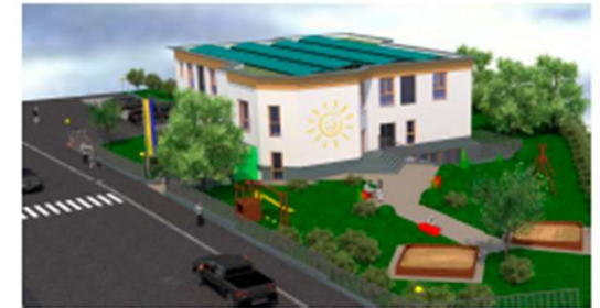
SCHAUBILD VON SÜDOSTEN