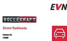
Abbildung 2: EVN Strom-Tankkarte